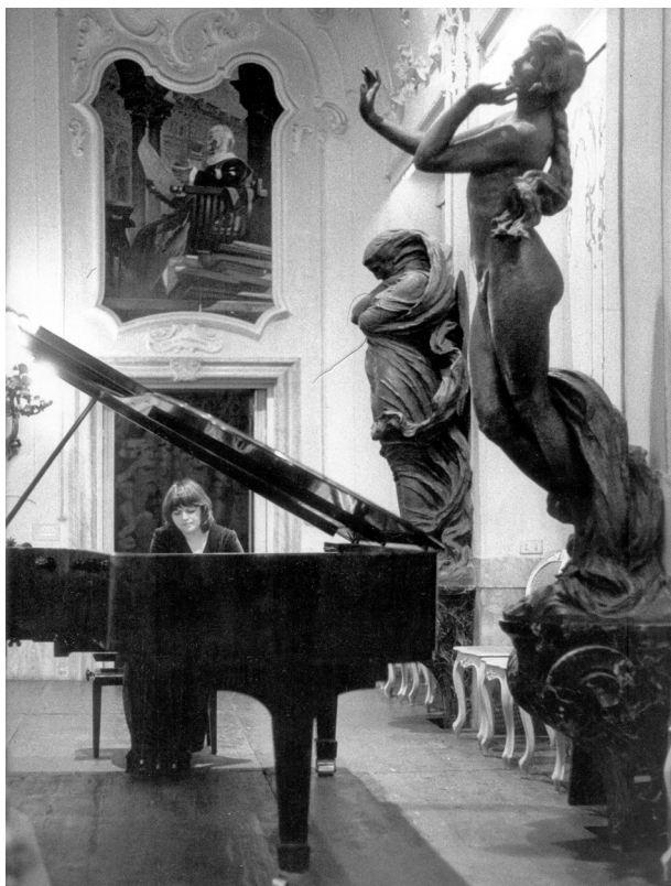
Ил. 1. Сольный концерт Елены Гилельс в Палаццо Киджи-Сарачини. Сиена, Италия. 20 февраля 1976 года