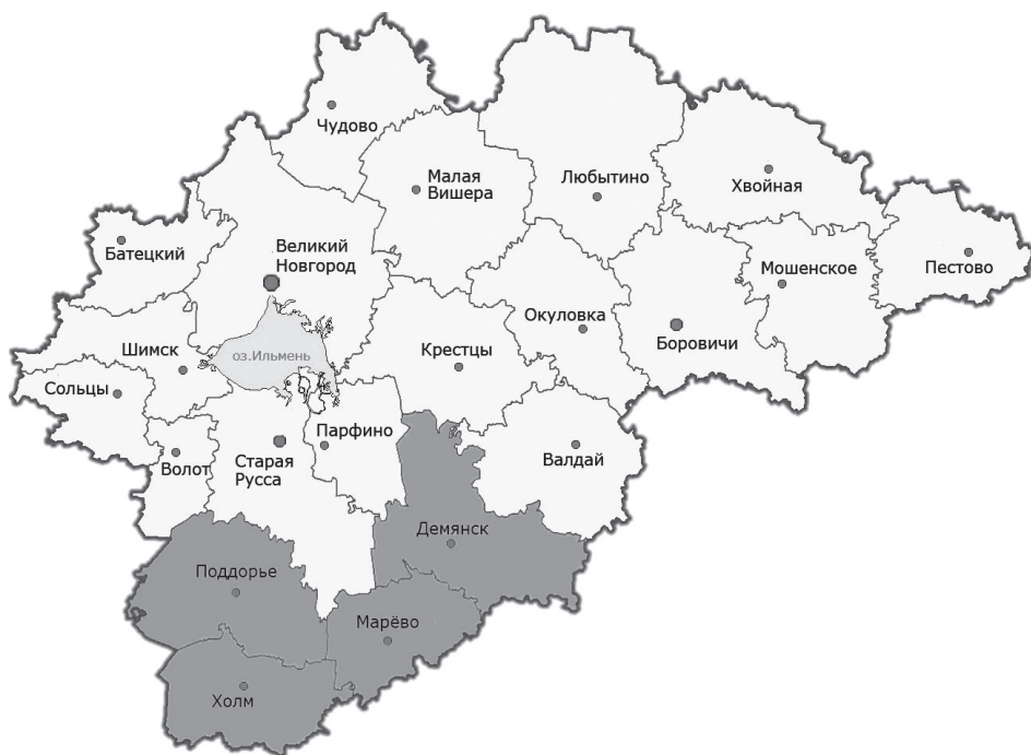
Карта Новгородской области

застолья в доме жениха, обозначая приветствие гостей («Здравствуй-здравствуй, Андрей-то душа»), начало свадебного пира («Соколы вы, соколы», «Русые кудри за стол пошли»), обряд раскрытия молодой («Рыбинка-плотичка, не брыкайся»), просьбы об одаривании («Павел-от с места встает»). Заклинательная функция проявляется в свадебных песнях, связанных, преимущественно, с силлабическим типом стиха, а также с некоторыми разновидностями тонического и дольного стихосложения.