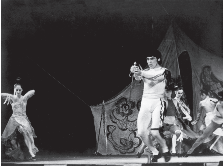
Илл. 4. Сцена из балета «Болеро» в Оперной студии Ленинградской консерватории. Фото. 1972

Fig. 4 A scene from the ballet “Bolero” on the stage of the Opera Studio of the Leningrad Conservatory. Photo. 1972