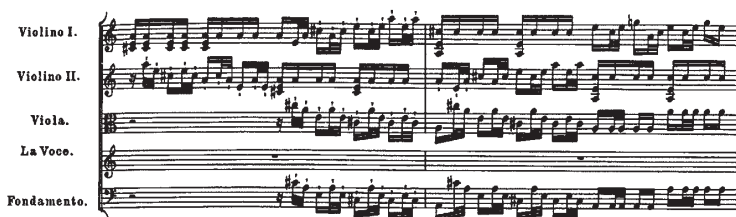
Ил. 8. Г. Ф. Телеман. Кантата «Ино». Облигатный речитатив Ино после первой арии (окончание)

держкой из двух скрипок, с характерной фактурой «покачивающихся волн» подводного мира (ил. 9).