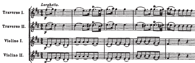
Ил. 9. Г. Ф. Телеман. Кантата «Ино». Larghetto.

Противопоставление двух сфер — человеческих страданий и безмолвно-го подводного царства — активизирует действие, делает его чрезвычайно захватывающим.