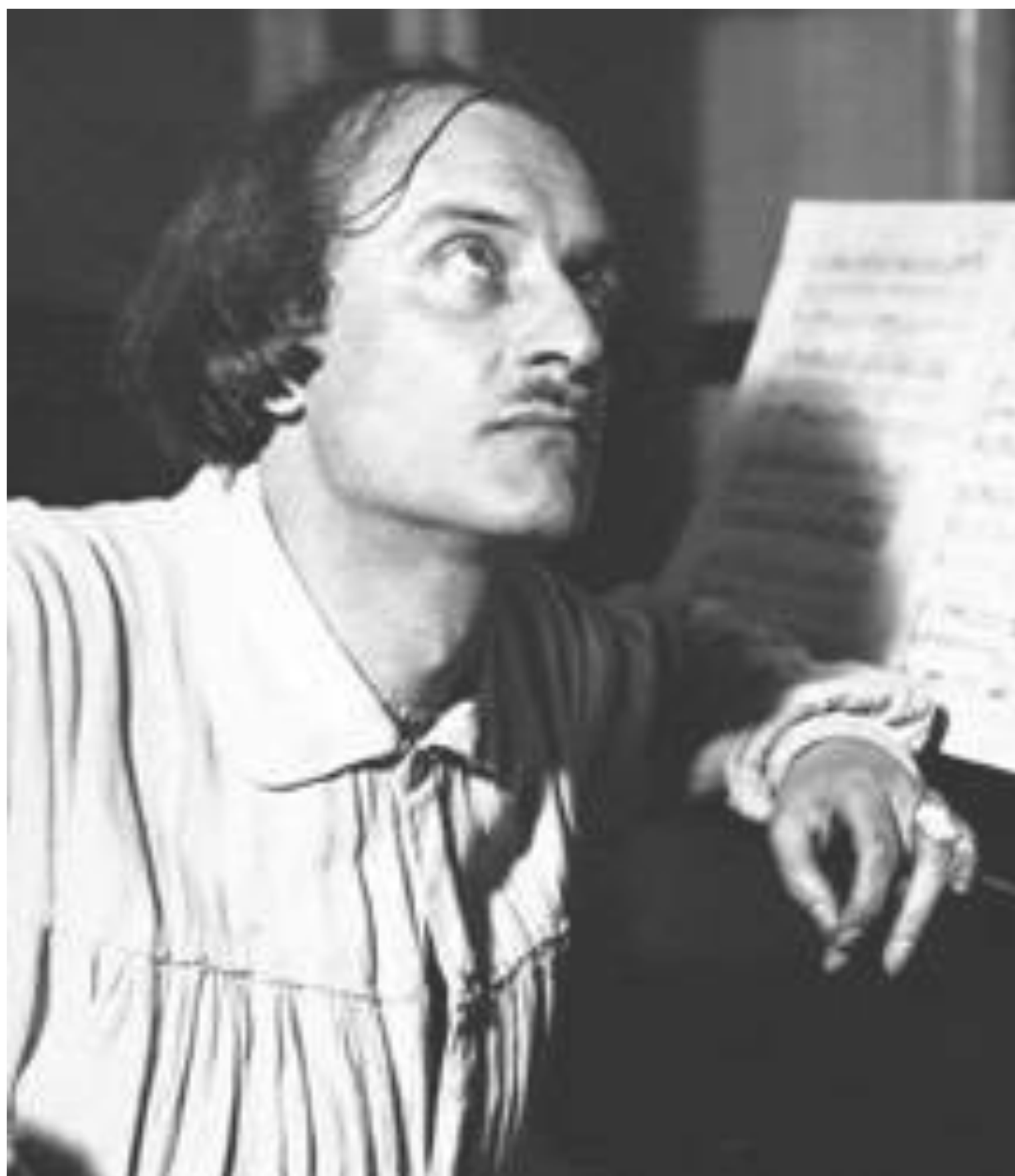
Ф. В. Лопухов

САНКТ-ПЕТЕРБУРГСКОЙ КОНСЕРВАТОРИИ ИМЕНИ Н.А. РИМСКОГО-КОРСАКОВА