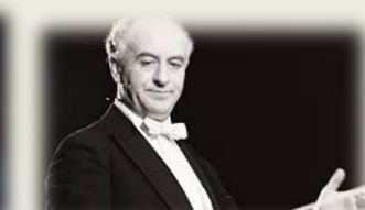
Р. Б. Баршай