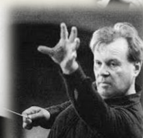
Е. Ф. Светланов