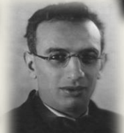
Б. Э. Хайкин