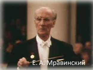
Е. А. Мравинский