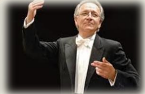
Ю. Х. Темирканов