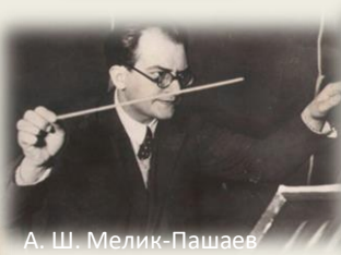
А. Ш. Мелик-Пашаев