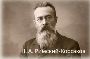
Н. А. Римский-Корсаков