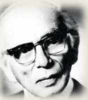
Л. М. Гинзбург