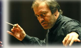
В. А. Гергиев