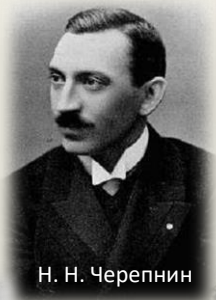
Н. Н. Черепнин