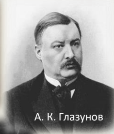
А. К. Глазунов