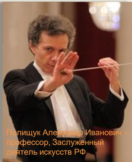
Полищук Александр Иванович – профессор, Заслуженный деятель искусств РФ

https://www.philharmonia.spb.ru/persons/biography/3880/